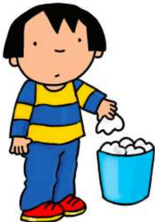
ZAKDOEKEN IN VUILNISBAK