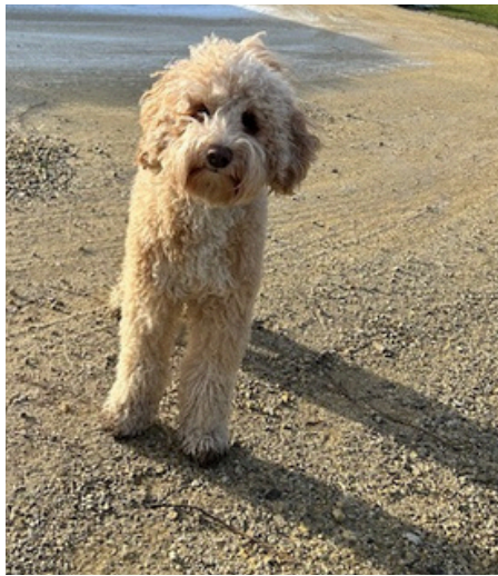
Woody, de schoolhond

Op onze website kan je alle info van de school terugvinden. We plaatsen heel regelmatig foto's van activiteiten in de klas en op de school. Heel leuk om als ouders samen met de kinderen te bekijken. Ze beginnen spontaan te vertellen over de klas en hun vriendjes.